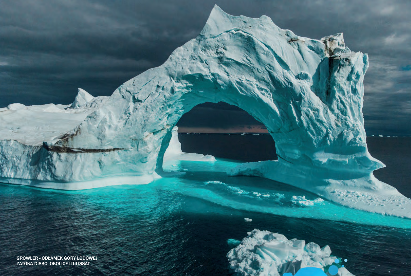
GROWLER - ODLAMEK GÓRY LODOWEJ ZATOKA DISKO, OKOLICE ILULISSAT